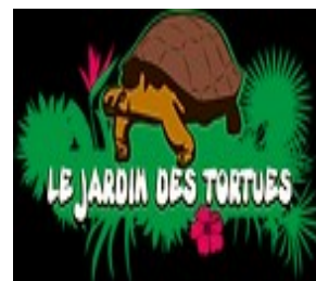
Plan de localisation Site du jardin des tortues

Le prix proposé inclut la visite et la dégustation d'une glace artisanale