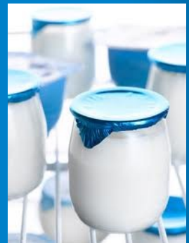
DAAF de La Réunion