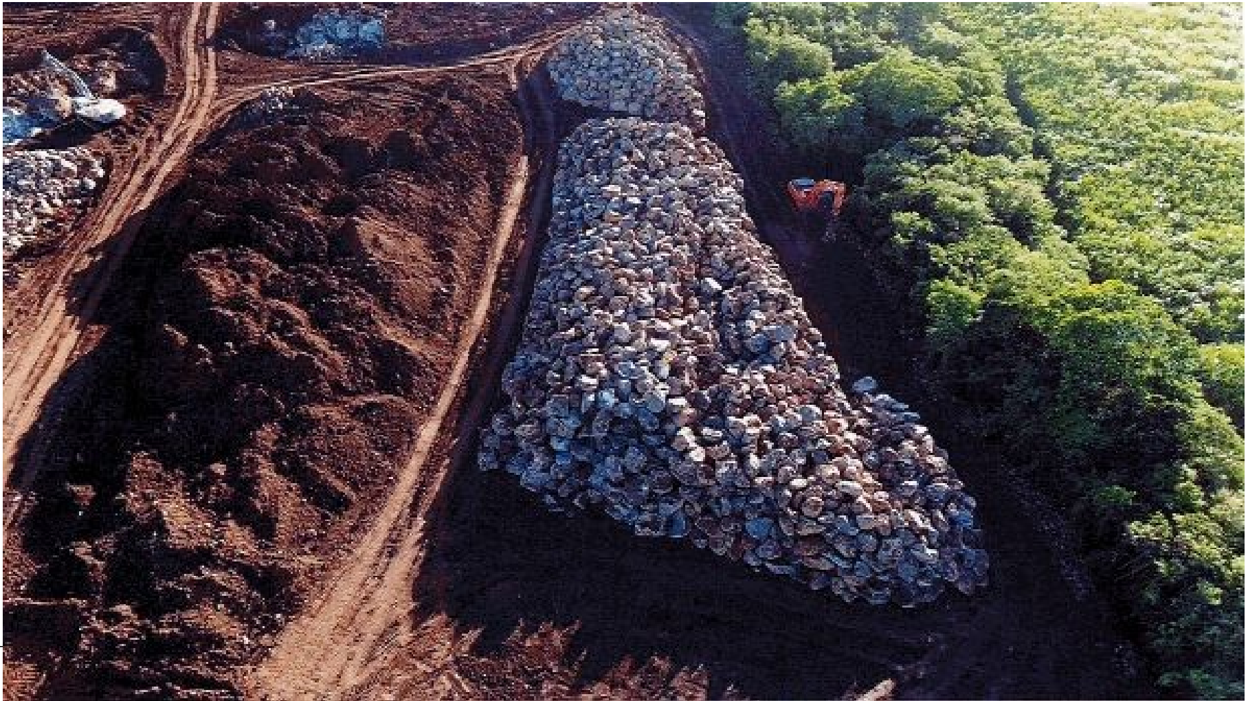
Illustration du chantier expérimental sur Saint Pierre